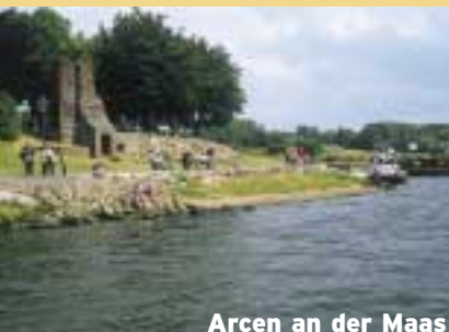
Arcen an der Maas

Ein Park voller Leben mit mehr als 800 Papageien, Leguanen, Kängurus, exotischen und heimischen Pflanzen. Ein „Kinderbauernhof“ mit Streicheltieren und der Indoor-Abenteuerspielplatz „Twisterland“ laden die Kleinen ein, sich nach Herzenslust auszutoben. Das Parkrestaurant bildet den kulinarischen Rahmen und ein Gartenmarkt bietet Blumen, Pflanzen und Ideen für Zuhause. (Entfernung: ca. 1 km)