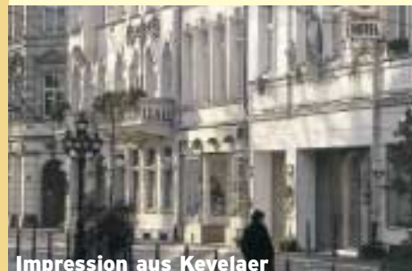
Impression aus Kevelaer